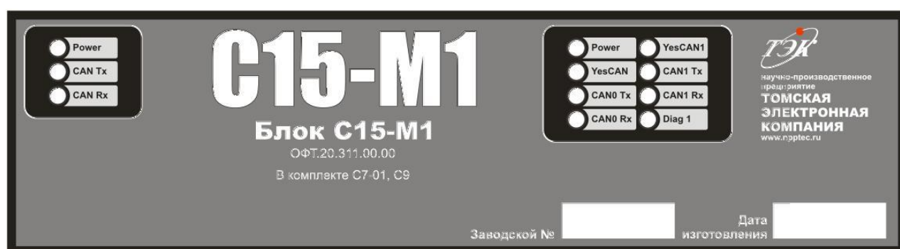
Рисунок 1 - Индикационное табло

Индикационное табло С15-М1 представляет собой 11 единичных индикаторов, расположение которых показано на рисунке 1. В левой части расположены индикаторы относящиеся к CAN1, а в правой к CAN0. Назначение единичных индикаторов С15-М1 приведено на рисунке 1.